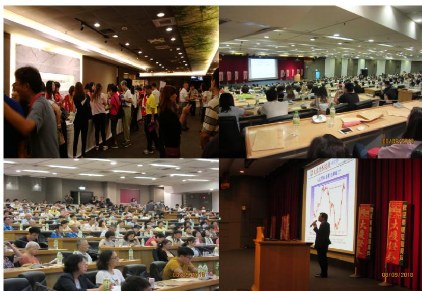
大慶證券於集思台大國際會議中心舉辦投資講座情形