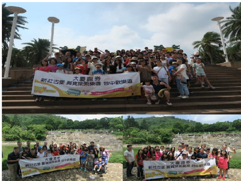
本公司員工旅遊活動情形