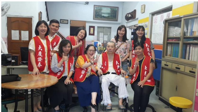
大慶證券同仁拜訪「高雄仁祥養護中心」

大慶證券全國共有 13 個據點，我們鼓勵各地據點員工積極與當地社區交流互動，關懷在地鄉親，了解鄉親的期望和需求，提供服務。我們希望藉由各分公司與當地社區鄉親議合互動的過程，融入當地社區，為地方貢獻心力，善盡社會責任。