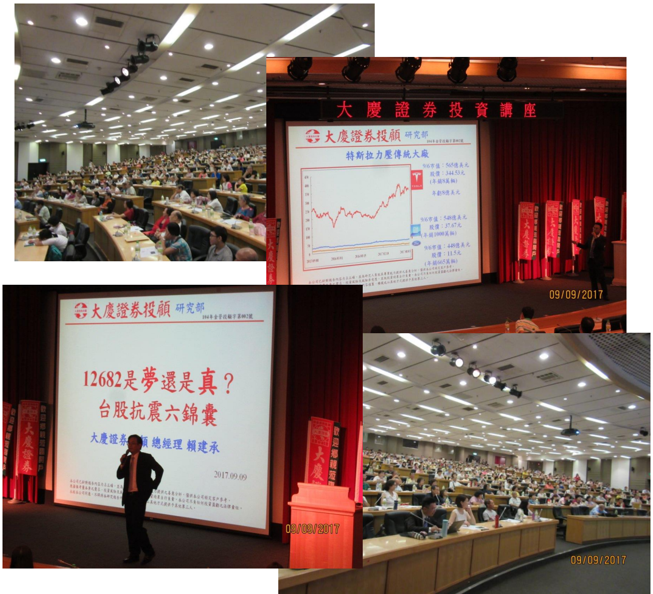
大慶證券於集思台大國際會議中心舉辦投資講座情形

台灣近年房價飆漲、所得分配惡化，低薪環境讓薪資成長遲緩，追不上物價上漲速度，小老百姓生活壓力升高，如何增加普羅大眾的收入已是重大課題，投資理財是解決問題的方法之一。大慶證券為推廣證券金融相關知識，協助包括弱勢族群在內的投資大眾學習投資理財專業技能，每年不定期舉辦免費投資講座，教育投資人正確的投資理財觀念，協助投資人培養交易與風險控管能力，提升投資績效。2017 年度共舉辦 52 場投資講座，獲得投資人熱烈迴響。