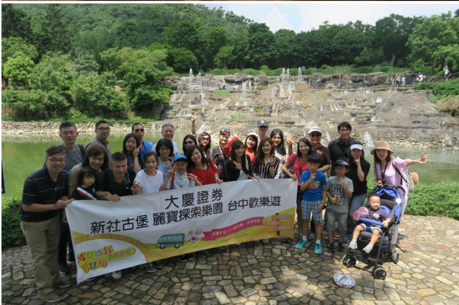
本公司員工旅遊活動情形